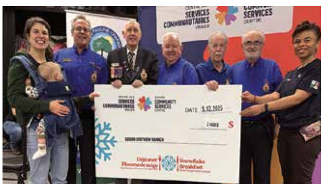
Contribution of 2,400 $ from Royal Canadian Legion Eastview Branch 462