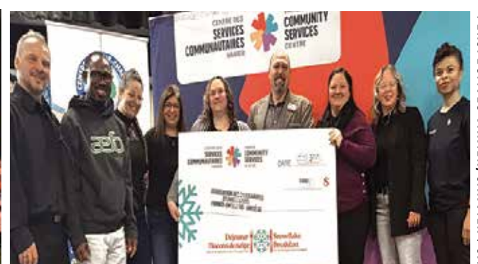
Contribution de 1 000 $ de l'AEEFO unité 66