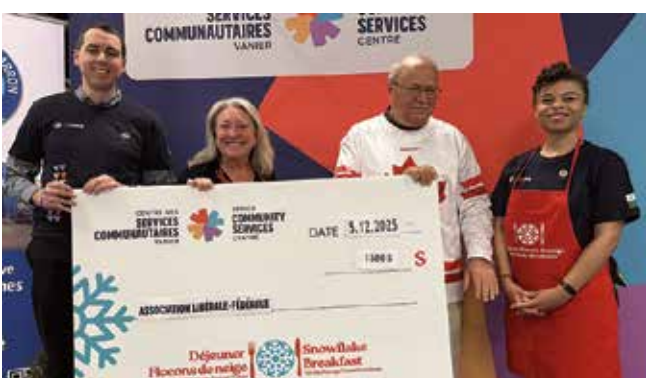
Contribution de 1 500 $ de l'Association libérale fédéral Ottawa-Vanier-Gloucester