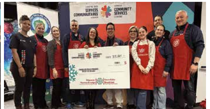
Contribution de 5 000 $ du Conseil des écoles publiques de l'Est de l'Ontario