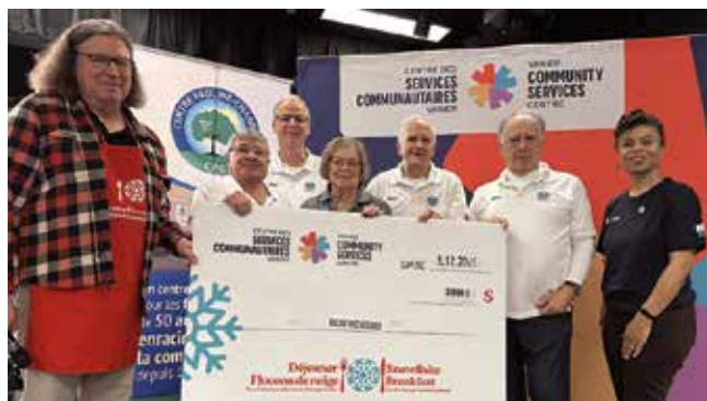
Contribution de 5 000 $ du Club Richelieu