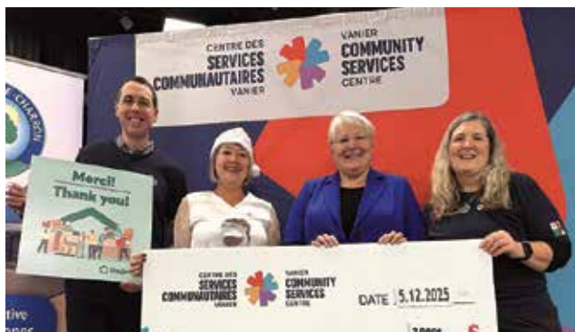
Contribution de 3 000 $ Caisses Desjardins Ontario