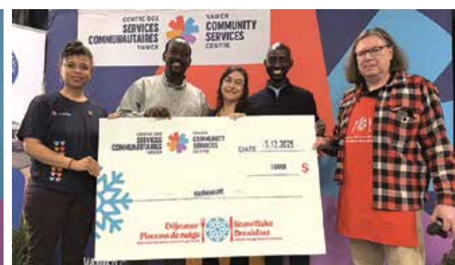
Contribution de 1 000 $ de La Cité