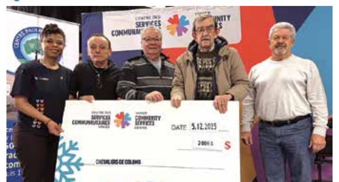
Contribution de 2 000 $ des Chevaliers de Colomb conseil 5571