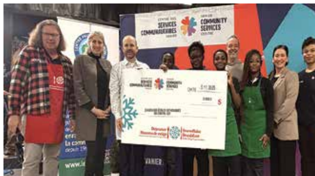
Contribution de 5 000 $ du Conseil des écoles catholiques du Centre-Est