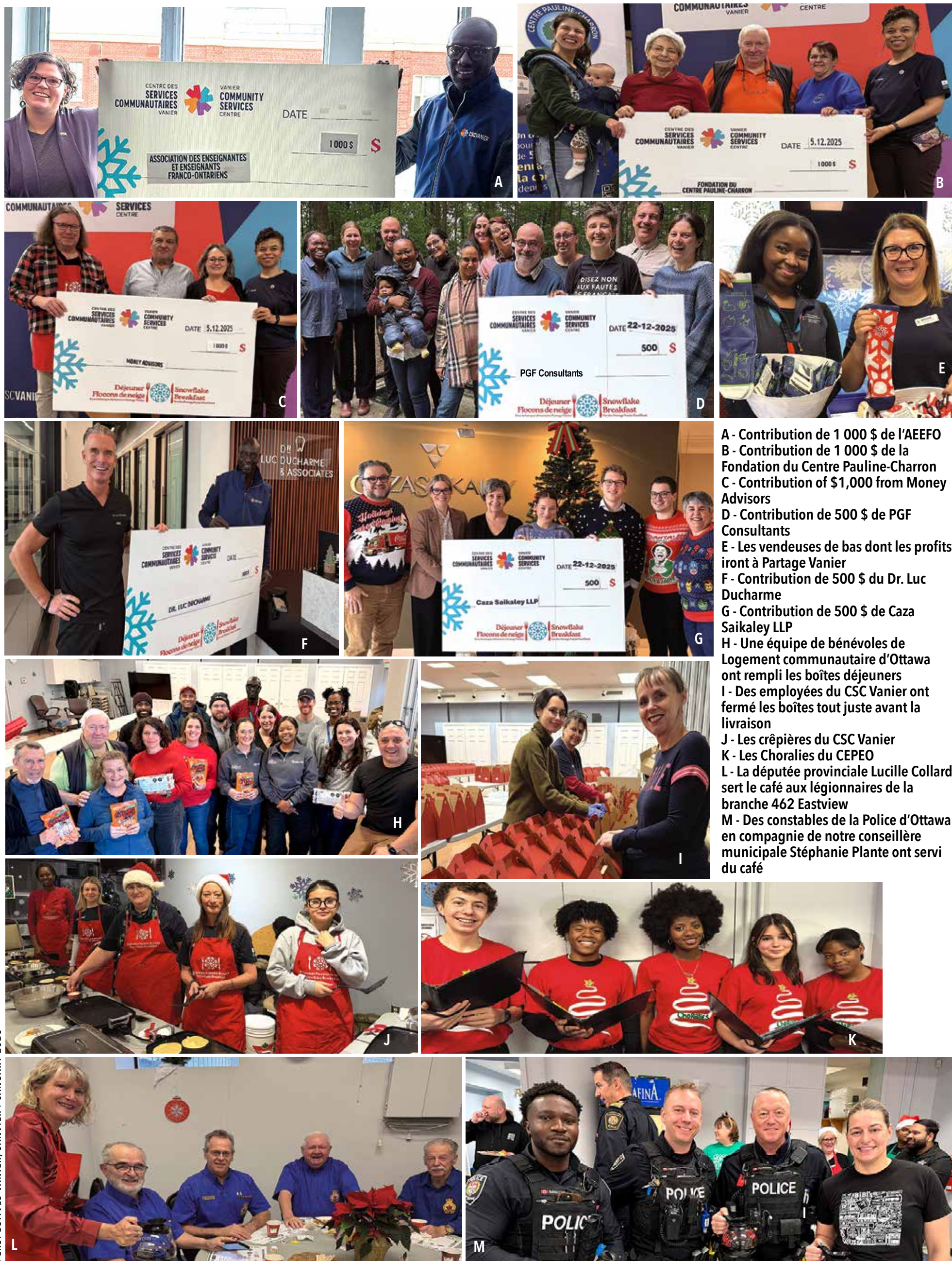
A - Contribution de 1 000 $ de l'AEFO