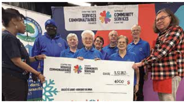
Contribution de 8 000 $ de la Saint-Vincent-de-Paul