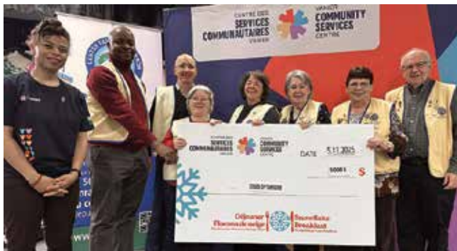
Contribution de 5 000 $ du Club Optimiste de Vanier