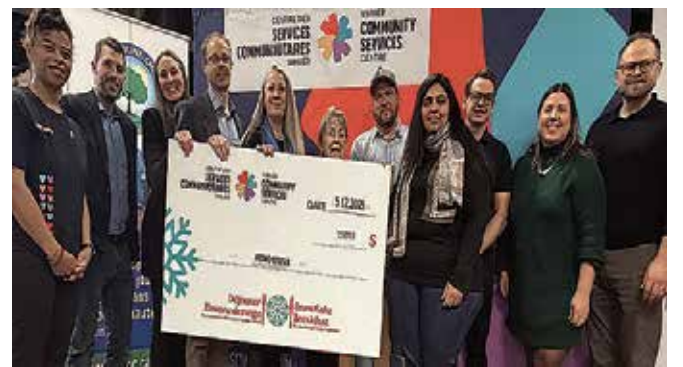
Contribution de 2 500 $ d'Hydro Ottawa