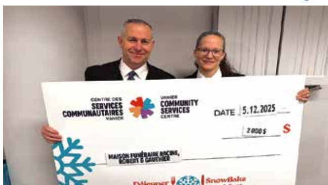
Contribution de 2 000 $ de Maison funéraire Racine, Robert & Gauthier